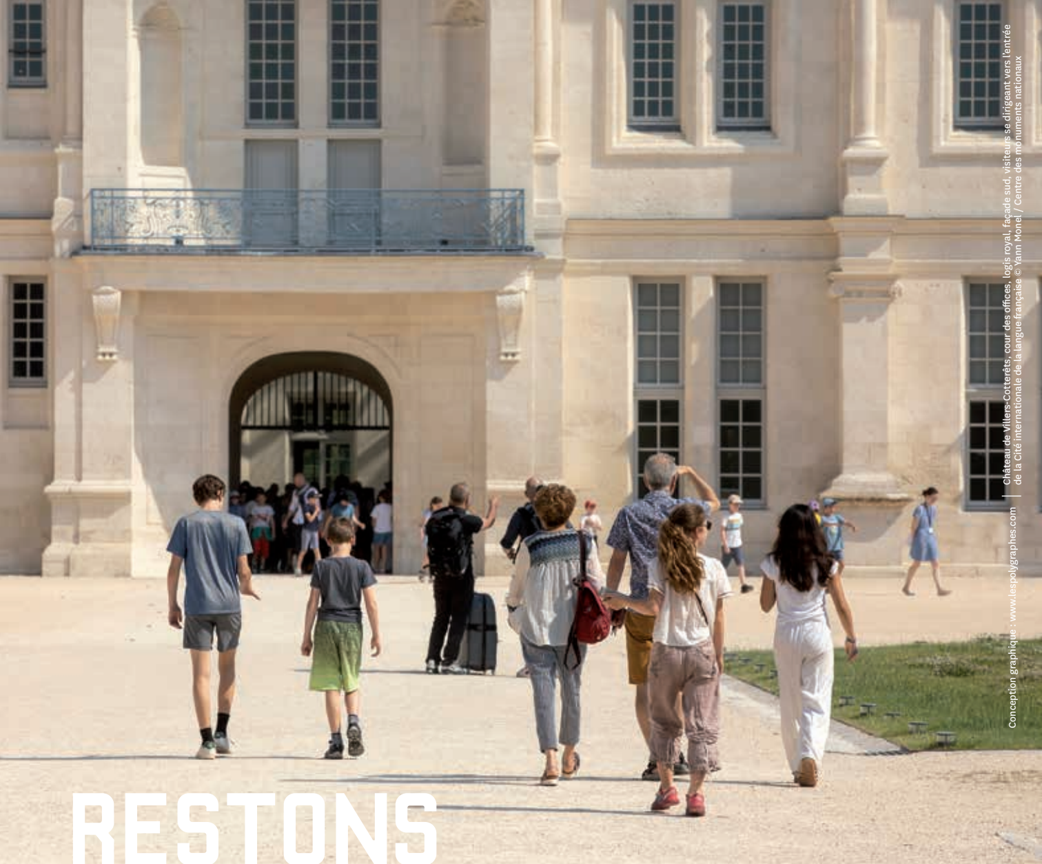
Château de Villers-Cotterêts, cour des offices, logis royal, façade sud, visiteurs se dirigeant vers l'entrée de la Cité internationale de la langue française Conception graphique : www.lespolygraphes.com