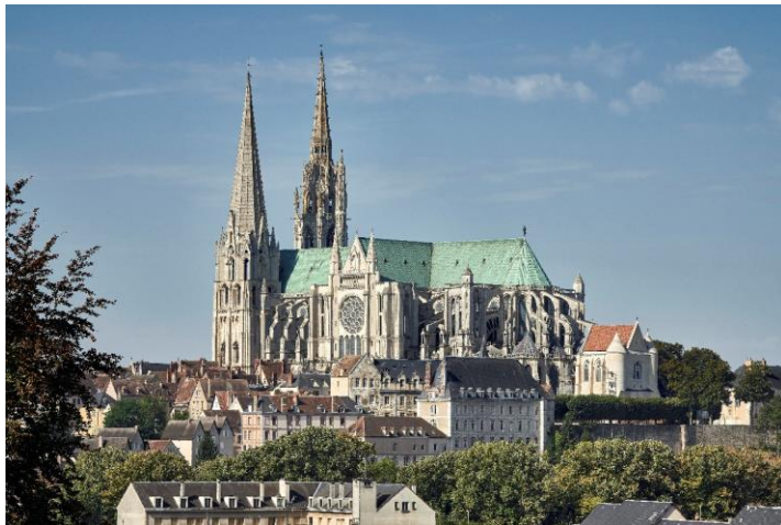
Cathédrale Notre-Dame de Chartres