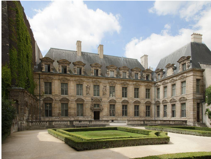
Hôtel de Sully