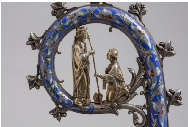
Crosse de monseigneur Mollien