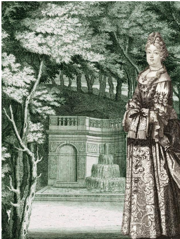
Parcours de visite « Saint-Cloud sous la plume de la Palatine »