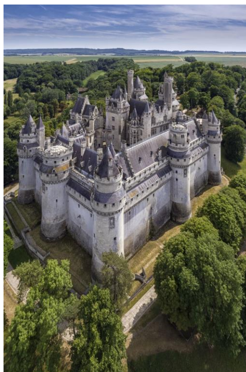
Château de Pierrefonds vu du nord