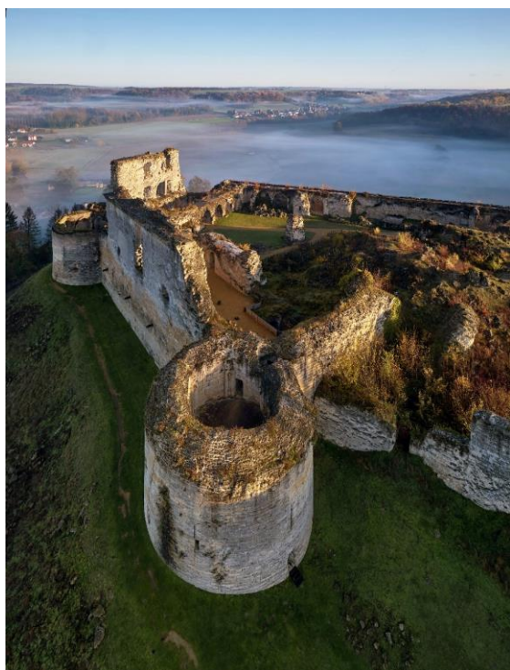
Château de Coucy, front ouest