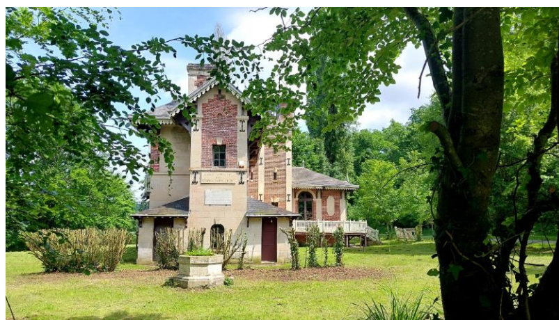
Pavillon Eugénie

Le Pavillon naît durant le Second Empire. Dans les années 1860 et 1861, sur ordre de Napoléon III, l'architecte du Palais de Compiègne Jean-Louis-Victor Grisart (1797-1877), restaure une ancienne maison de garde, la « maison des étangs », et y adjoint un nouveau bâtiment pour l'usage de l'empereur. Cet ensemble, aujourd'hui dénommé Pavillon de l'Impératrice, est pensé selon le style « chalet », témoignant de la volonté des souverains d'intégrer la nouvelle construction dans son décor forestier et dans le site nouvellement aménagé du Lac Saint-Pierre.