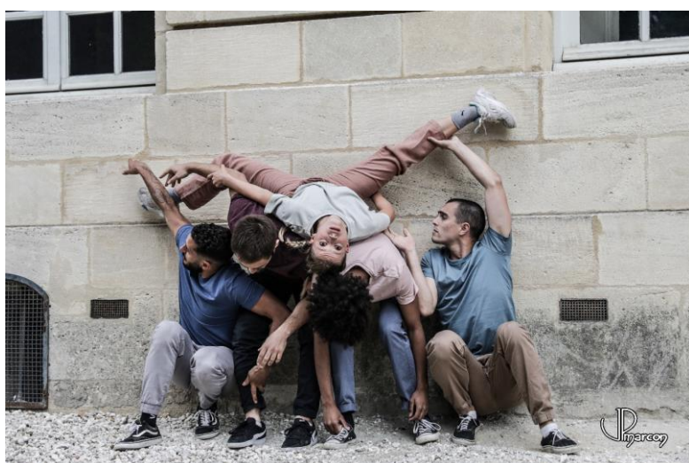
GIC (Groupe d'Intervention Chorégraphique)