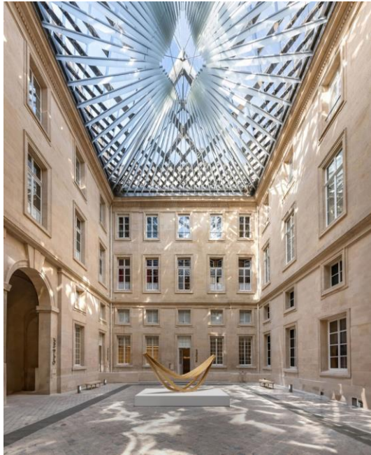
Pierre Renart, Escale, vue 3D à l'Hôtel de la Marine