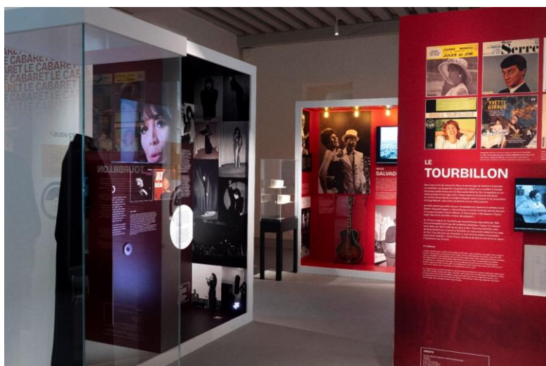
Exposition C'est une chanson qui nous ressemble - Cité internationale de la langue française