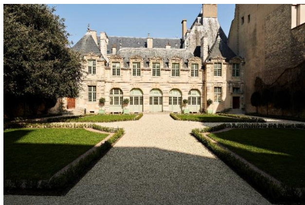
Jardin de l'hôtel de Sully

Cette exposition, organisée dans le jardin et l'Orangerie de l'Hôtel de Sully, met en lumière l'importance de la numérisation pour la préservation, la recherche et la diffusion des sites patrimoniaux. Elle dévoile au public les grandes étapes d'une numérisation, depuis l'acquisition des données jusqu'à la création et l'utilisation finale des modèles 3D. Plusieurs projets sont mis en avant : numérisation d'un monument bâti (Arc de triomphe), d'un site archéologique (grotte de Font-de-Gaume) et de collections patrimoniales (château de Champs-sur-