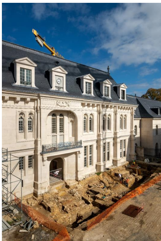
Fouilles archéologiques devant le logis royal du château de Villers-Cotterêts