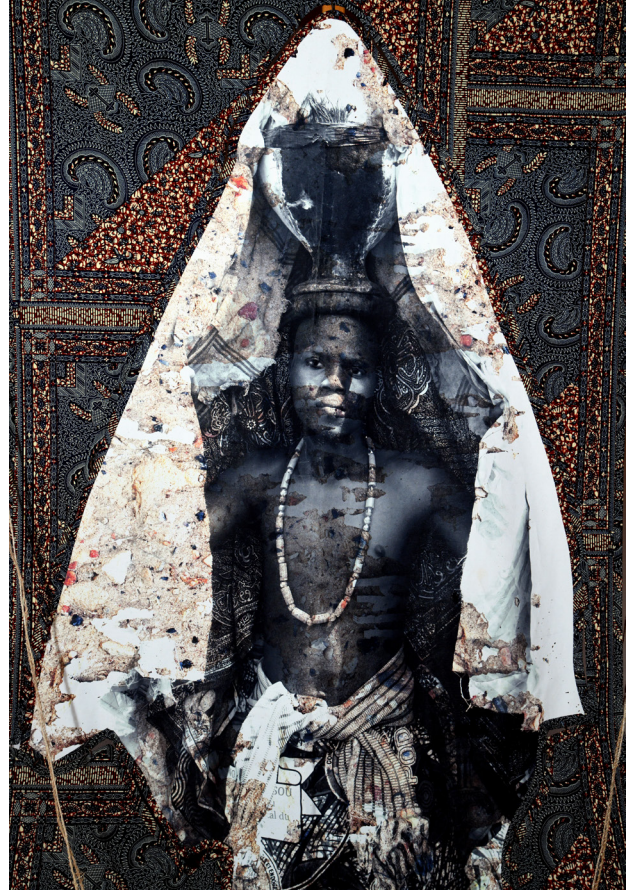
Louis Oké-Agbo, Voile de reconnaissance, Collection particulière, 146 x 197 cm, 2024, photo © Louis Oké-Agbo, (détail de l'oeuvre)