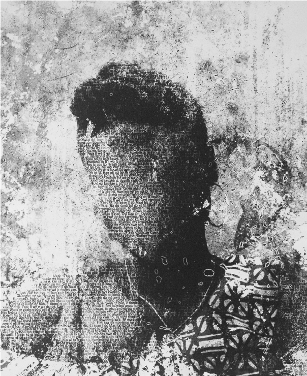
Sènamì Donoumassou, Xogbe – série ako mla mla- Agenùvì hwelinù, Collection nationale du Bénin, 61 x 50,8 cm, 2022