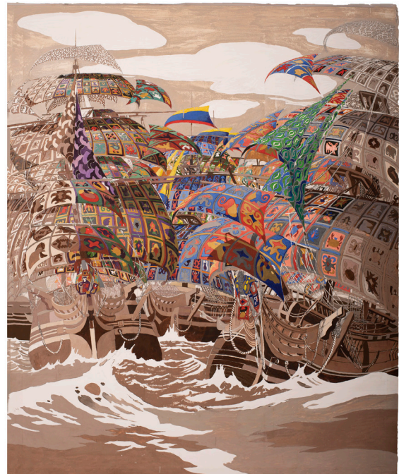
Julien Sinzogan, Le retour des esprits, Collection nationale du Bénin, 220x180cm, 2021