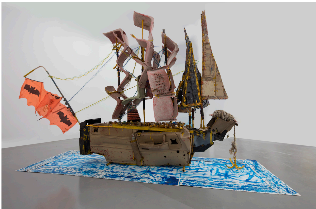
Aston, Le voilier du temps, Collection Galerie Vallois, 260x280x65cm, 2016

Après l'installation de l'ensemble sculpté « La Bataille de Little Bighorn » d'Ousmane Sow à la Place forte de Mont-Dauphin, pour une durée de dix ans, et la carte blanche confiée à l'artiste ghanéen El Anatsui à la Conciergerie en 2021, le Centre des monuments nationaux présente ici un troisième projet dédié à la création contemporaine africaine.