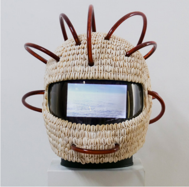
Emo de Medeiros, Série Vodunaut Hypercyber, Collection nationale du Bénin, 2021, photo © Emo de Medeiros