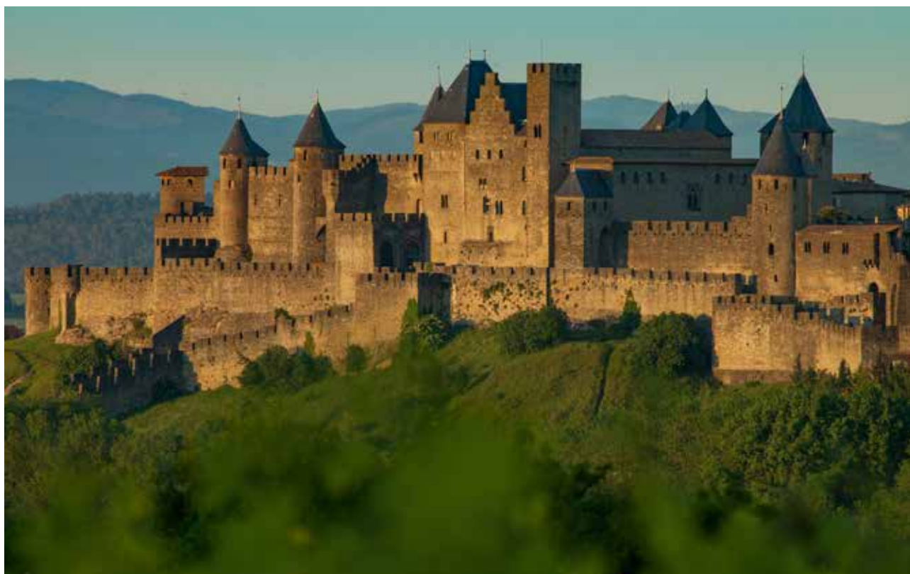
Le château comtal de Carcassonne © Philippe Benoist.

En se connectant sur www.mapierreeledifice.fr , les amoureux du patrimoine peuvent faire un don pour le château et les remparts de Carcassonne (« mon monument préféré ») et ainsi contribuer à les animer, les entretenir et les préserver.