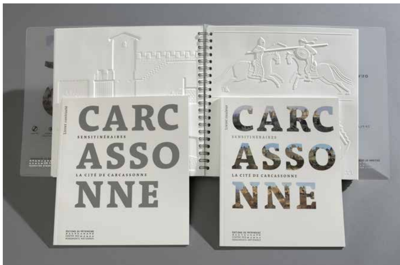
Sensitinéraire Carcassonne

Format 31,5 X 28 cm | ISBN : 978-2-85822-990-1