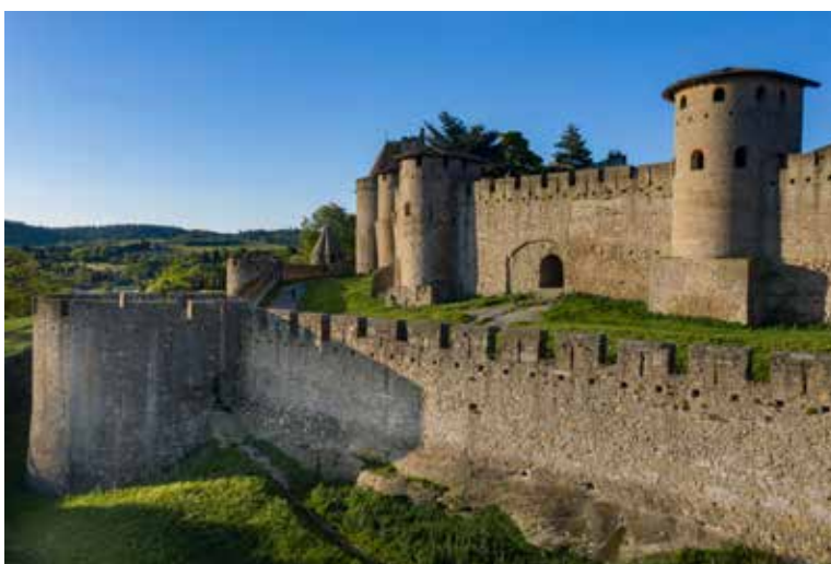
Front ouest des remparts de Carcassonne © Philippe Benoist. Front nord des remparts de Carcassonne © Philippe Benoist.