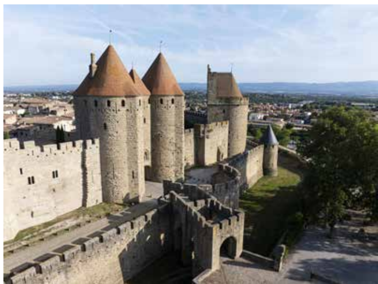
Cité de Carcassonne, porte Narbonnaise après restauration