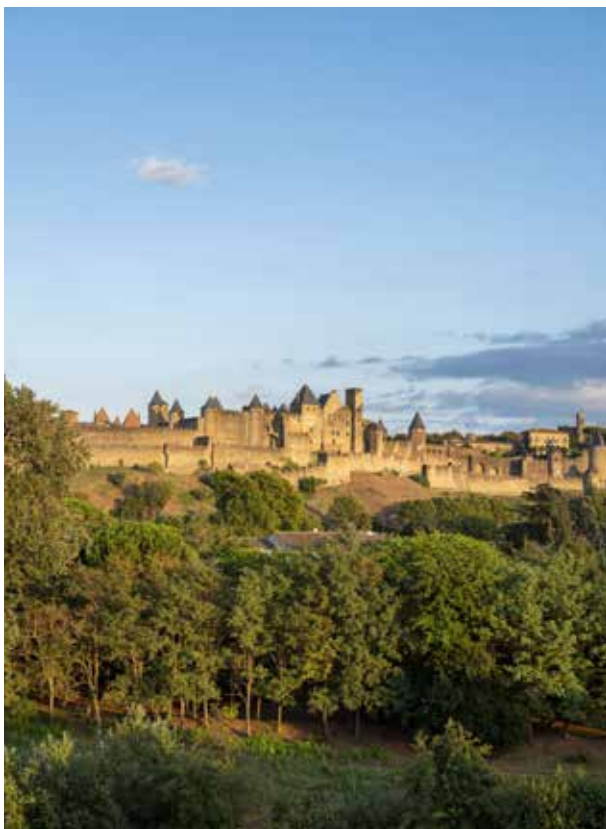
Cité de Carcassonne

Un parcours sonore, au sein du château, dans la cour et sur les remparts, accompagnera les visiteurs qui le souhaiteront (tarification spécifique). Il se déclinera selon leurs envies, entre « guide personnel » façon podcast ou chroniques historiques quasi cinématographiques. Le « guide personnel » proposera une narration ponctuée d'ambiances musicales déroulant l'histoire du château au travers d'anecdotes sur la psychologie de personnages historiques et de révélations sur le monument (histoire, architecture et techniques, restauration, le château dans les arts et la littérature...). Les chroniques historiques mettront en scène des personnages réels ou fictifs à l'aide d'ambiances sonores cinématographiques (voix, bruitages et musiques), donnant la sensation au visiteur d'être plongé au cœur de l'action historique présentée. Ces chroniques immersives aborderont également l'histoire et les éléments architecturaux du château. Le parcours apportera un confort de visite inédit, grâce à son déclenchement automatique et à sa très bonne qualité sonore. La signalétique directionnelle et d'accueil, entièrement repensée, sera un allié indéniable pour orienter les visiteurs, portés par ces histoires sonores.