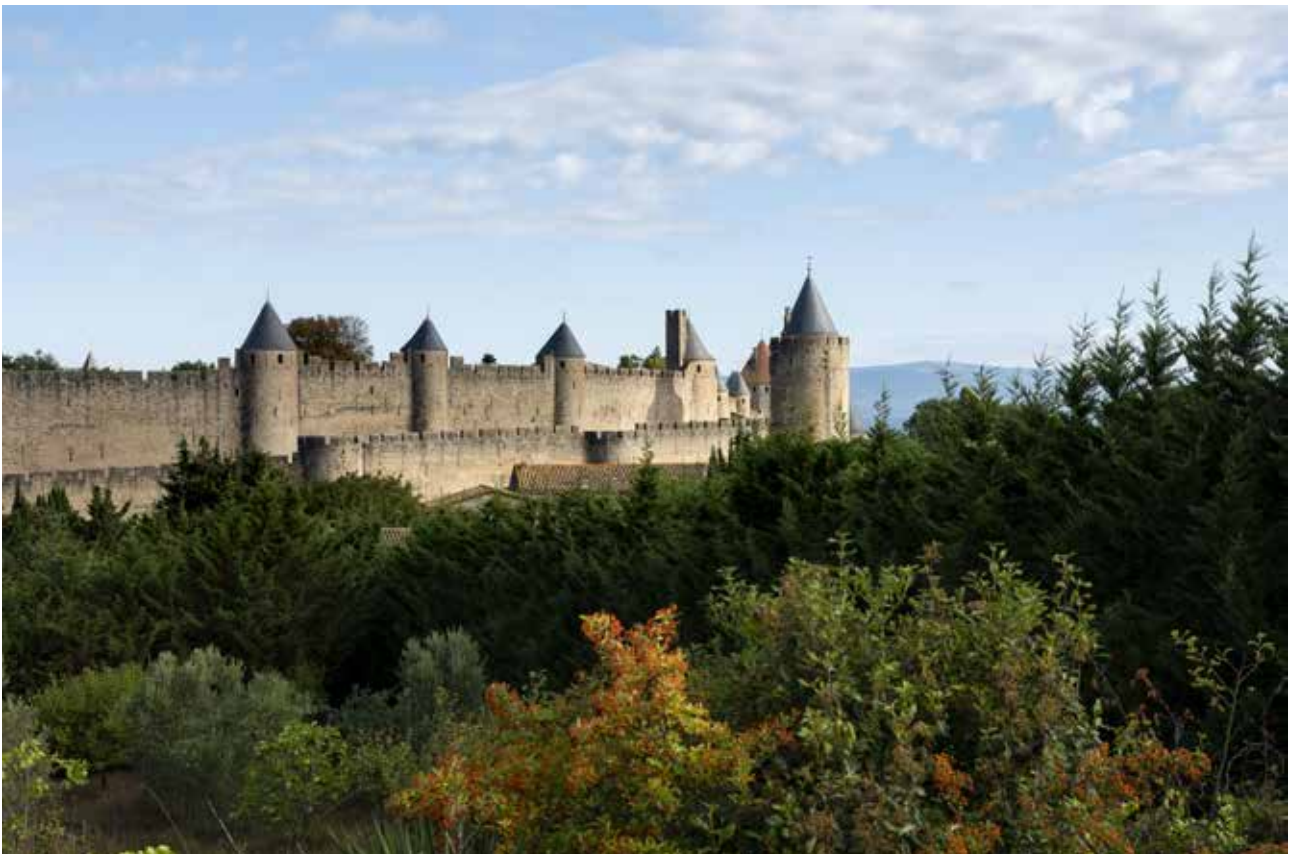
La cité de Carcassonne © Philippe Benoist.

On peut penser que c'est cet épisode qui déclenche des travaux plus conséquents : le rempart existant se