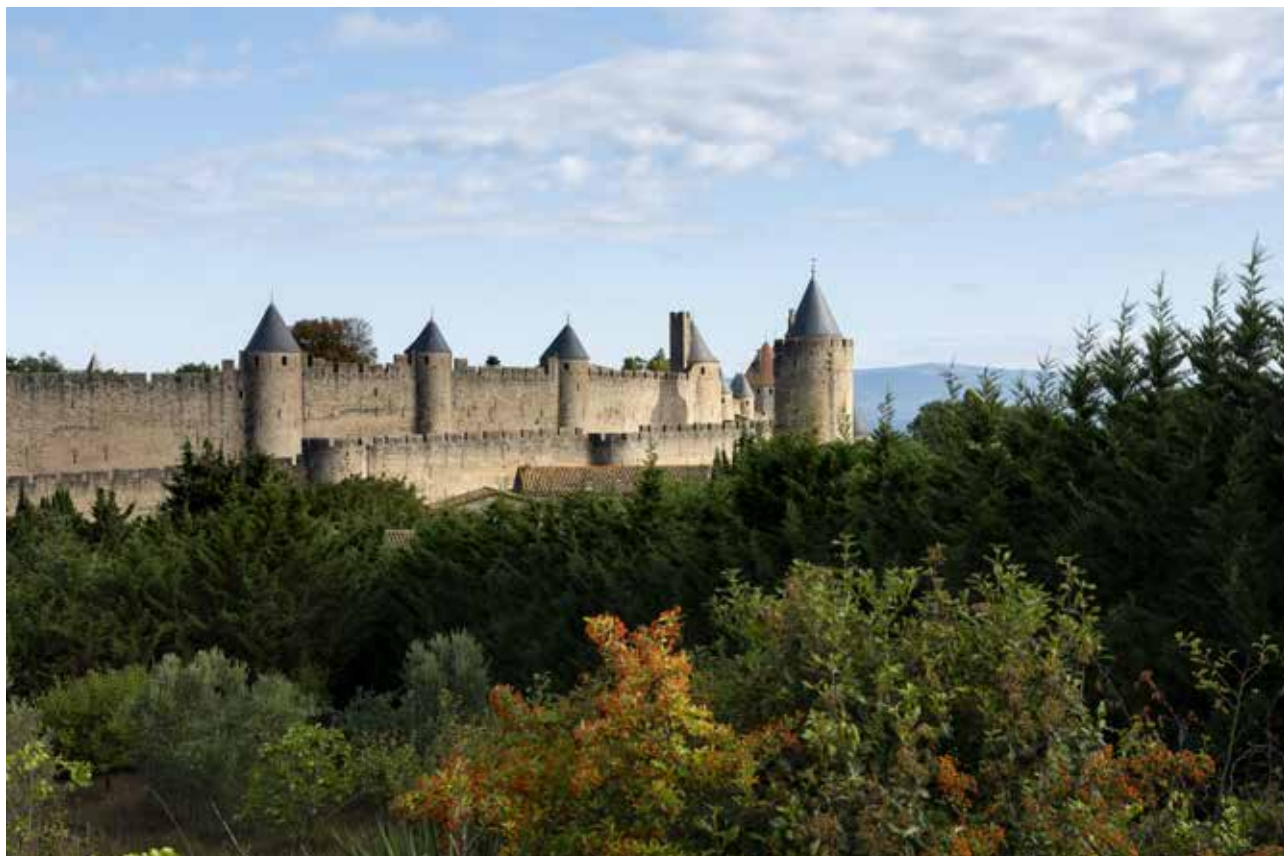
La cité de Carcassonne © Philippe Benoist.

On peut penser que c'est cet épisode qui déclenche des travaux plus conséquents : le rempart existant se