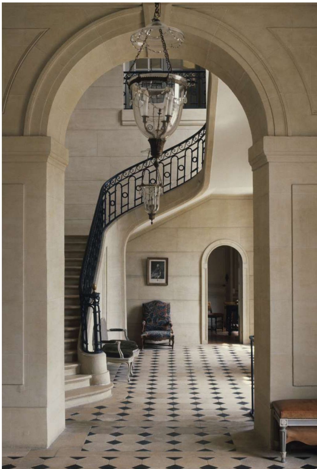
Château de La Motte Tilly