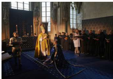
Château de Châteaudun

Série « Police » en 2019 au domaine national de Saint-Cloud