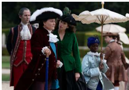
Château de Champs sur-Marne - Jeanne du Barry

Film produit par Légende Films « J'accuse » en 2019 au domaine national de Saint-Cloud