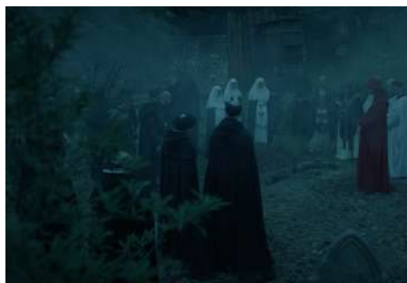
Abbaye de Montmajour © Centre des monuments nationaux

Série produite par Paramount+ « Daryl Dixon » en 2023 à l'abbaye du Mont-Saint-Michel et en 2022 à l'abbaye de Montmajour