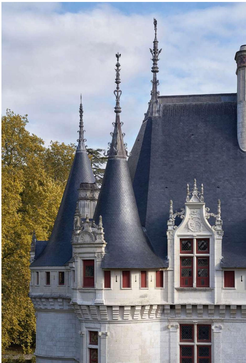
Château d'Azay-le-Rideau