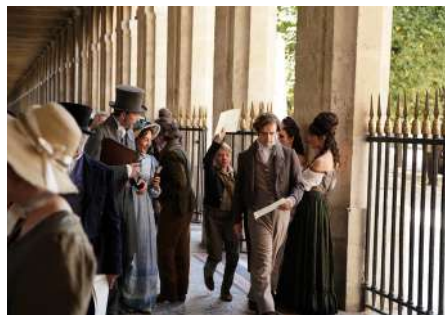
Domaine national du Palais-Royal © Les Illusions perdues de Glanoli - Centre des monuments nationaux

Film produit par Tarantula Belgique « Pompéi » en 2018 au site archéologique de Glanum