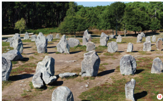
10. Arc de Triomphe