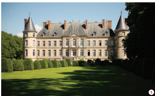
7. Hôtel de Sully © Centre des monuments nationaux 8. Château de Champs-sur-Marne © Centre des monuments nationaux 9. Château de Haroué © Colombe Clier - Centre des monuments nationaux