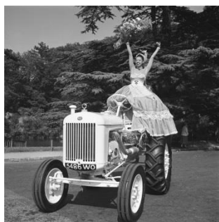
Joséphine Baker