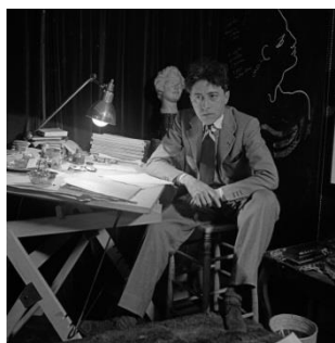
Jean Cocteau dans son appartement