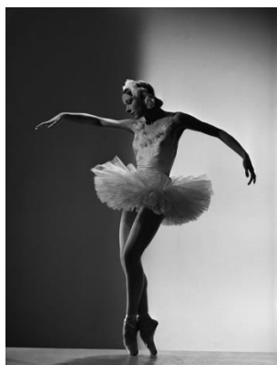
Yvette Chauviré dans "La mort du cygne"