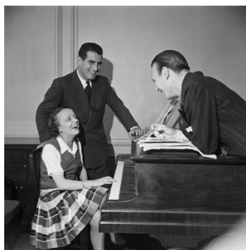
Édith Piaf, Jean Chevrier et Henri Contet chez Marguerite Monnot