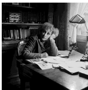
Colette chez elle, au Palais-Royal