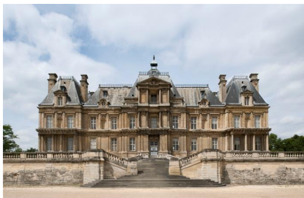
Façade sur jardin du château de Maisons

Depuis sa création, le château de Maisons n'a jamais cessé d'être considéré comme l'une des plus grandes réussites de l'art français. Il est un des exemples le plus raffiné du château classique français. Situé dans les boucles de la Seine, non loin de Saint-Germain-en-Laye, le château de Maisons, construit par François Mansart (1598-1666) dans la première moitié du XVII e siècle pour René de Longueuil, président à mortier au parlement de Paris est également considéré comme l'un des grands chefs-d'œuvre de cet immense architecte.