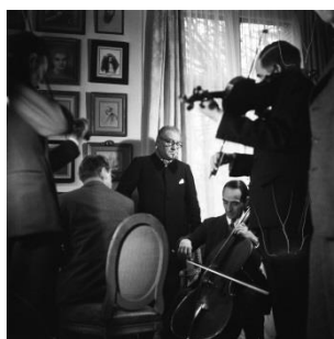
Sacha Guitry chez lui